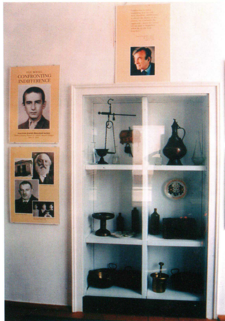
Imagini din muzeul memorial

S-a reconstituit aici un colț cu masa de lucru, spații intime de rugăciune și meditație. Tot aici, pe panouri special concepute sunt prezentate secvențe biografice, iar prin fotografii sunt rememorate vizitele lui Elie Wiesel în Sighetul Marmăției și întâlnirile sale cu membrii comunității și cu oficialitățile locale.