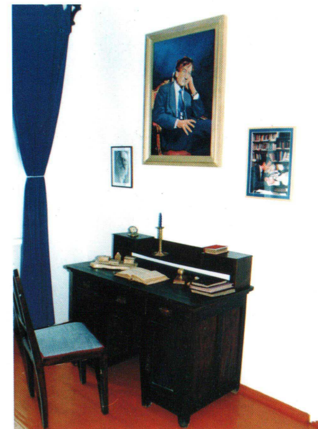
Imagini din camera memorială

Curtea casei - muzeu a fost concepută special ca un spațiu de odihnă și reculegere.