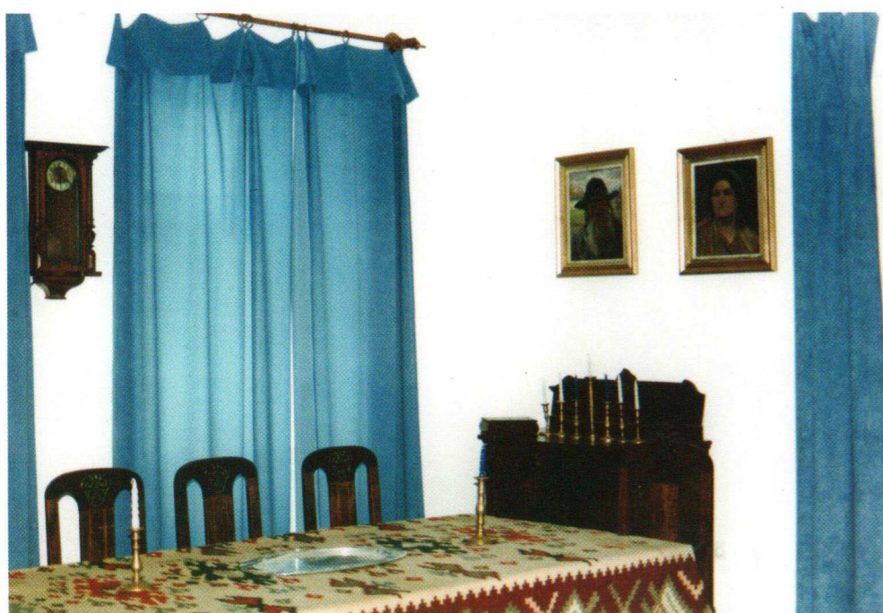
Tablouri și mobilier de epocă care au aparținut evreilor sigheteni

Sala a treia prezintă consecințele actului de la 30 august 1940 - Dictatul de la Viena care a dus la încorporarea Maramureșului și a Transilvaniei de Nord la Ungaria horthystă. Prin fotografiile, documentele, obiecte personale și alte mărturii este prezentată constituirea ghetourilor și consecința acestora, holocaustul-marea tragedie a deportării și exterminării întregii comunități evreiești din Sighet și Maramureș.