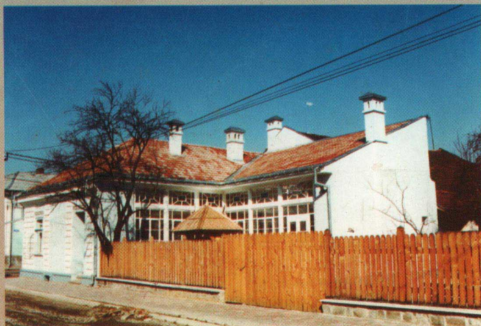
Casa memorială Elie Wiesel