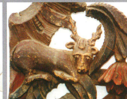
Obiecte de cult