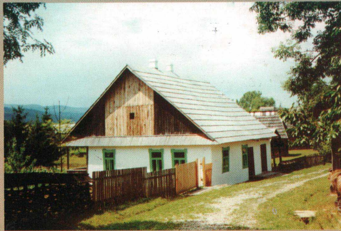
Casa evreiască Drimer din Bârsana restaurată în Muzeul Satului Maramureșean