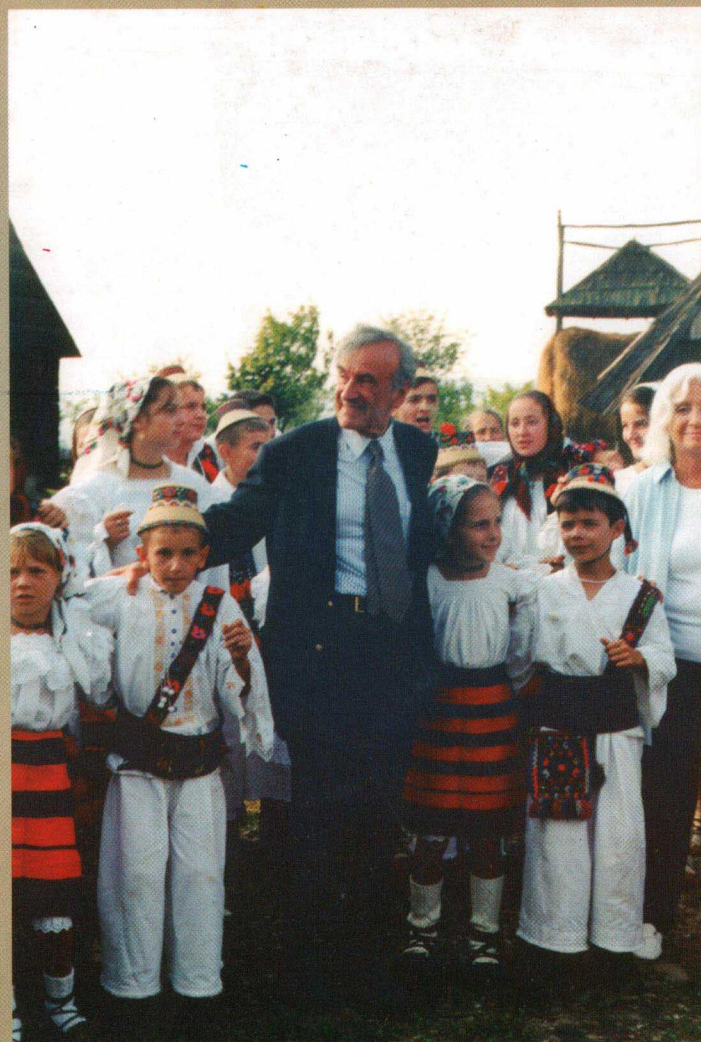
Elie Wiesel în Muzeul Maramureșului